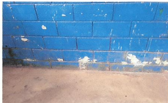
Foto 2: Pintura interior y exterior de centro educativo, colocación de piso cerámico.