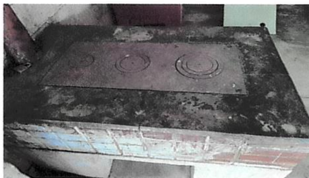
Foto 4: Cambio de estufa lorena y chimenea, reconstrucción de polletón.